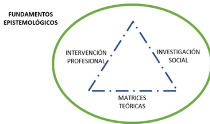
Imagen 1. Fundamentos epistemológicos para la praxis profesional en el Trabajo Social